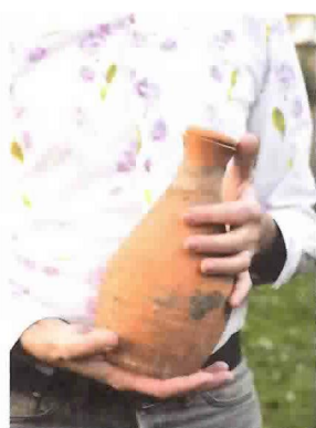
128_JOURNAL D'UN JARDINIER