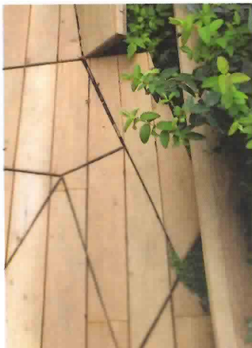
14_ESPACES & MATIÈRES

Tableau d'heuchères (H.) et d'Heucherella (x H.). De gauche à droite: en haut, H. 'Binoche' - H. 'Citronnelle' - x H. 'Sweet Tea' - x H. 'Mojito'; au milieu, H. 'Frosted Violet' - x H. 'Mojito' - H. 'Frosted Violet'; en bas, H. 'Binoche' - x H. 'Sweet Tea' - x H. 'Mojito'.